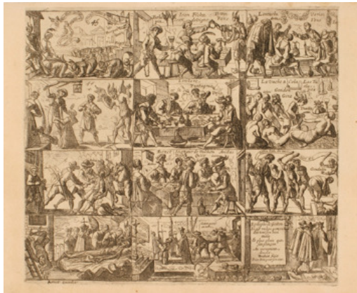
Pierre Brebiette, Histoire de Geiton , vers 1635, eau-forte