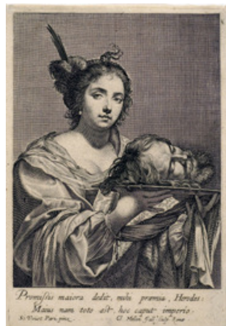
Claude Mellan d'après Simon Vouet, Hérodiade , vers 1624-1627, burin