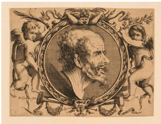
Nicolas Cochin le Vieux d'après Denis Bouthemie, L'éclatant Bouthemie , eau-forte et burin

Cette émulation, entre « gravure d'interprétation » et « gravure originale », suscita un formidable essor dans le domaine de l'estampe, et ses formes d'expression se multiplièrent. L'image s'imposa dans les livres : pleines pages illustrées et vignettes accompagnèrent le texte. Planches d'almanachs, vues topographiques et sujets pieux tapissaient également les murs. Trois genres rencontrèrent alors un large succès : la gravure de portrait, la gravure de mode et la gravure d'ornement et toute cette production était orchestrée par les éditeurs et marchands d'estampes. Ambassadeurs du goût français, ils formèrent et alimentèrent les premières collections étrangères.