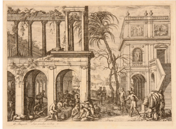
Henri Mauperché, Adoration des bergers , avant 1687, eau-forte et burin